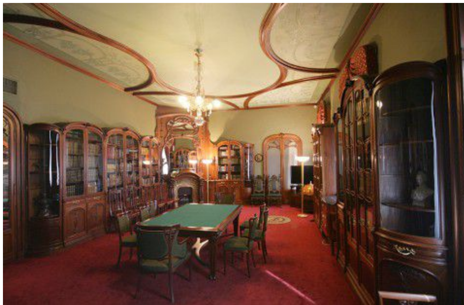
Дом Искусств. Библиотека