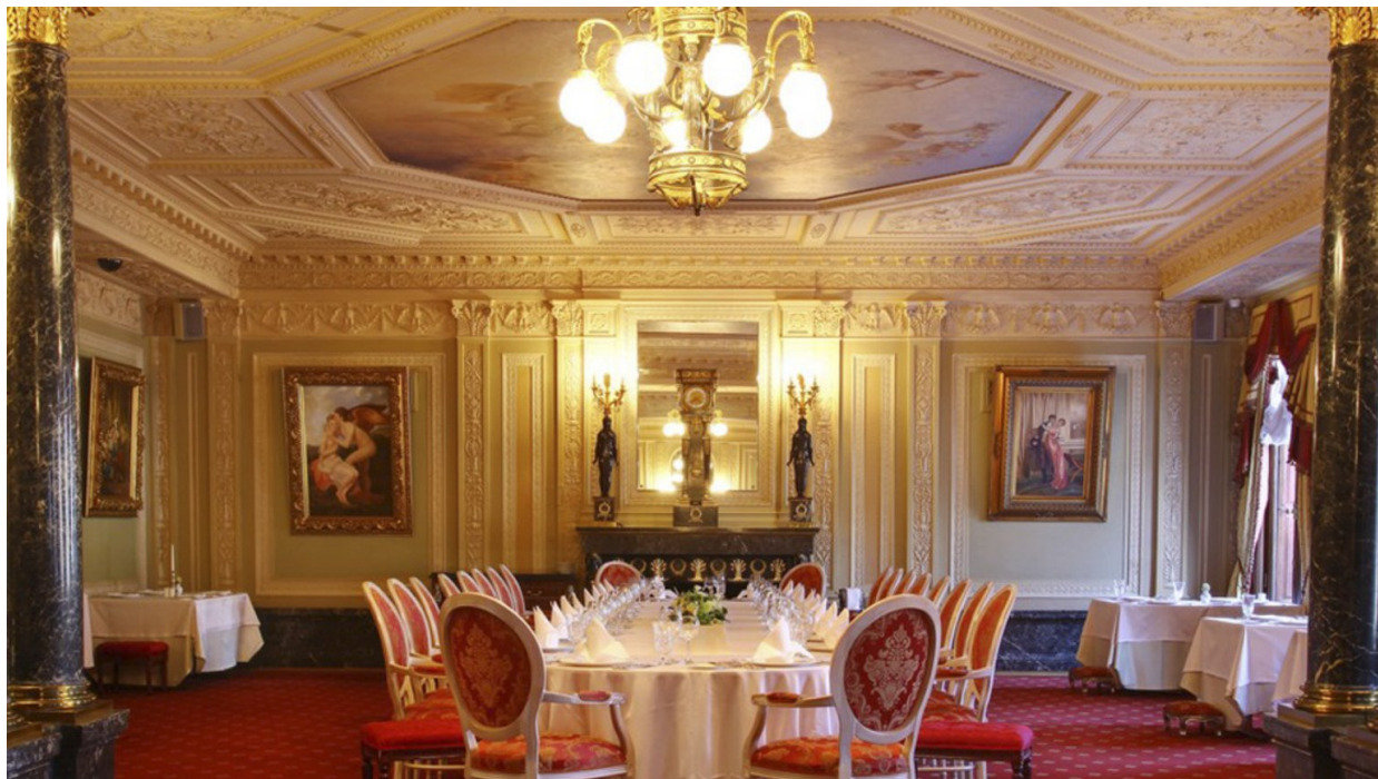
Дом Искусств. Салон