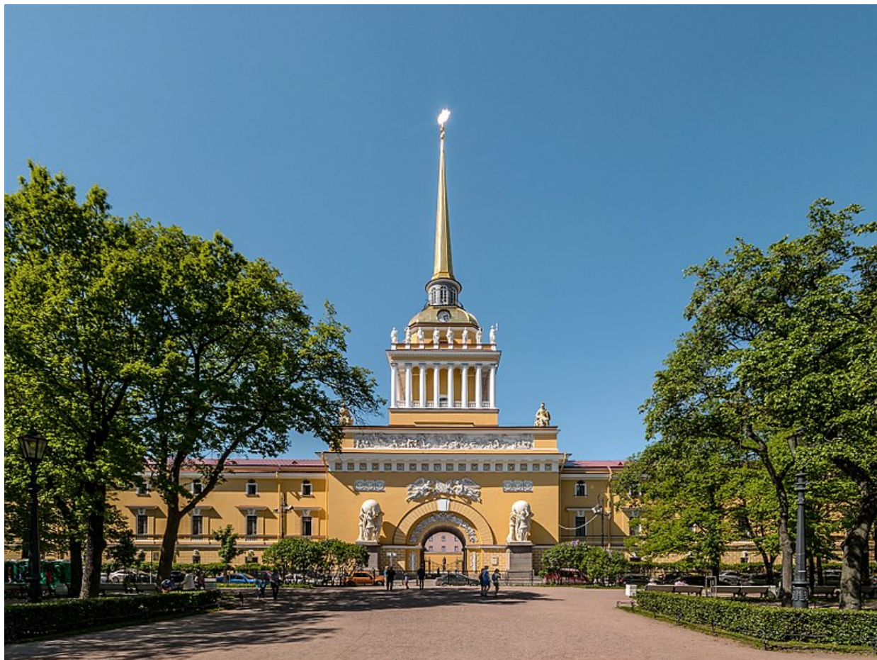
Адмиралтейство в Петрограде