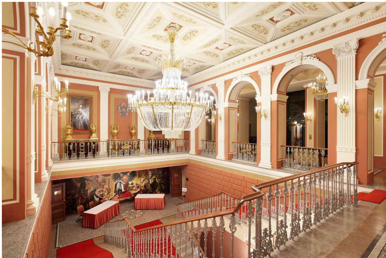
Дом Искусств. Приёмная