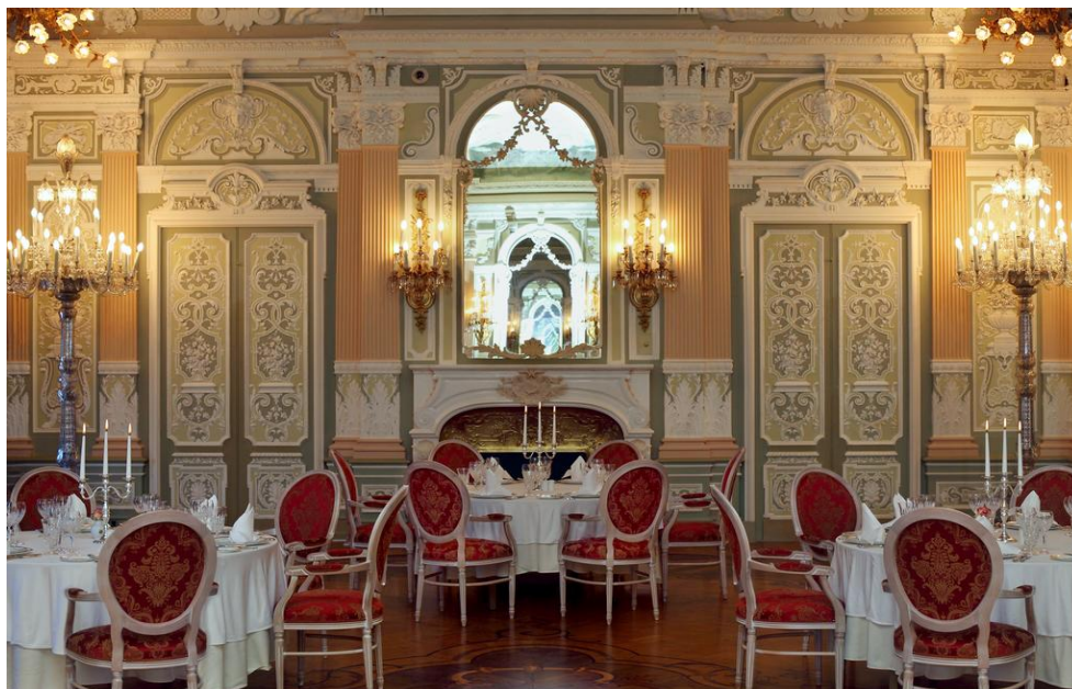
Дом Искусств. Столовая