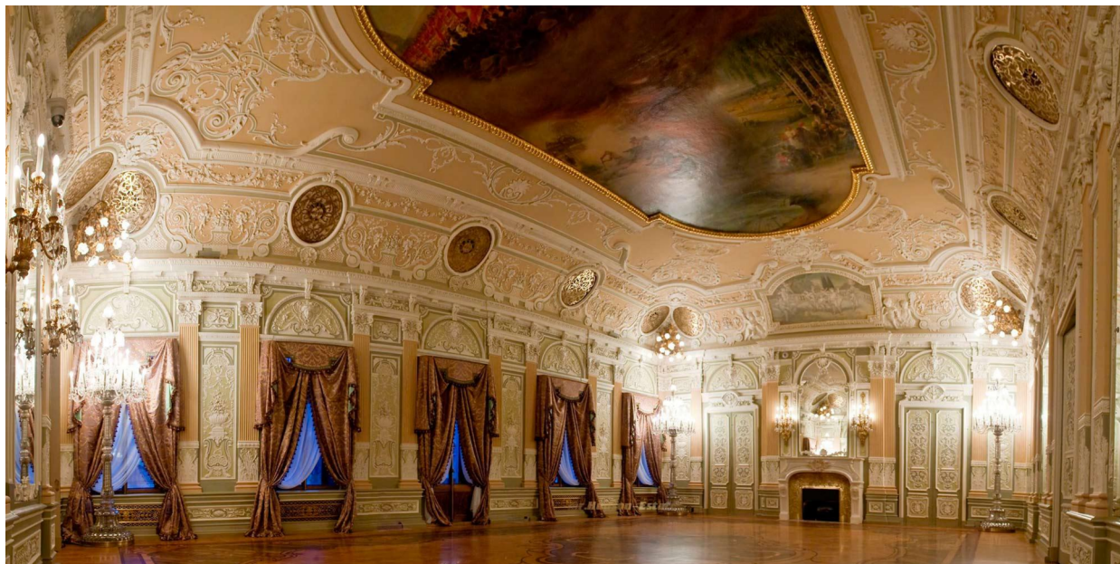
Дом Искусств. Бальный зал