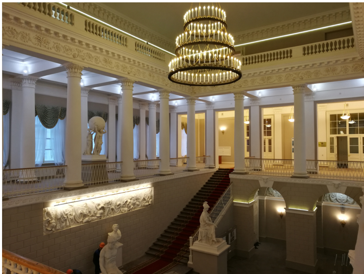
Адмиралтейство в Петрограде. Боковая лестница