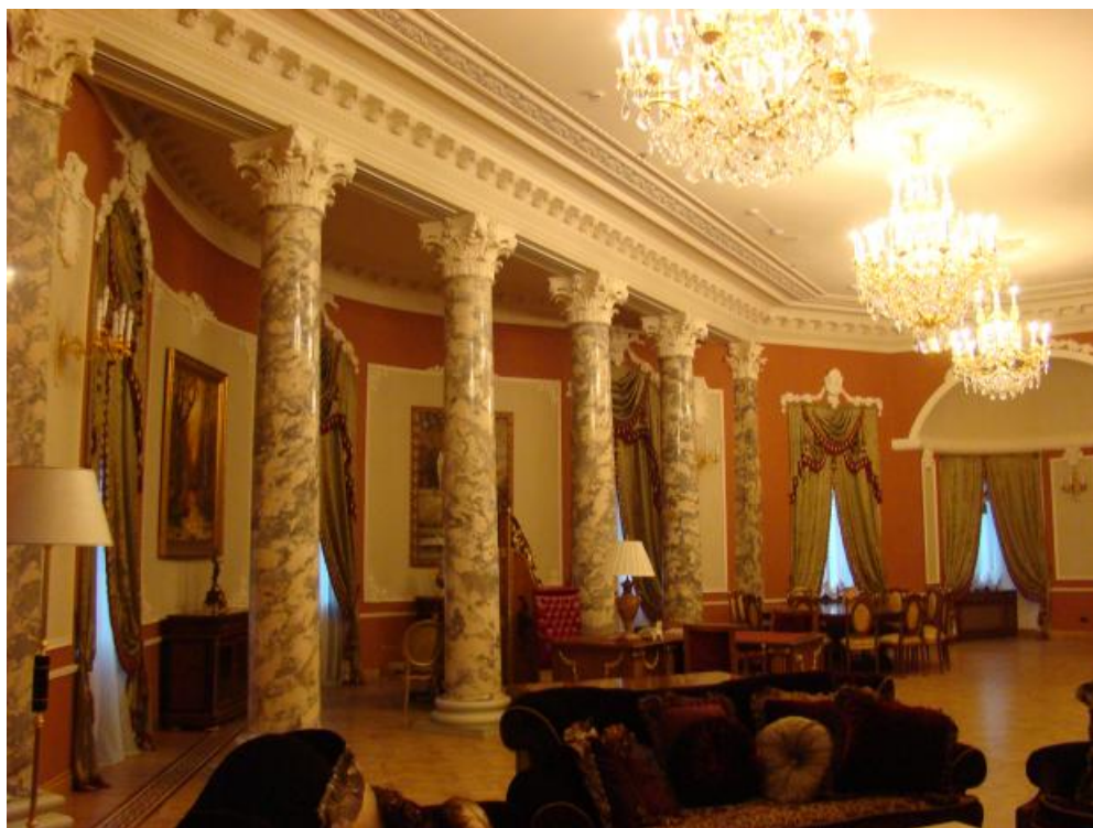
Дом Искусств. Холл