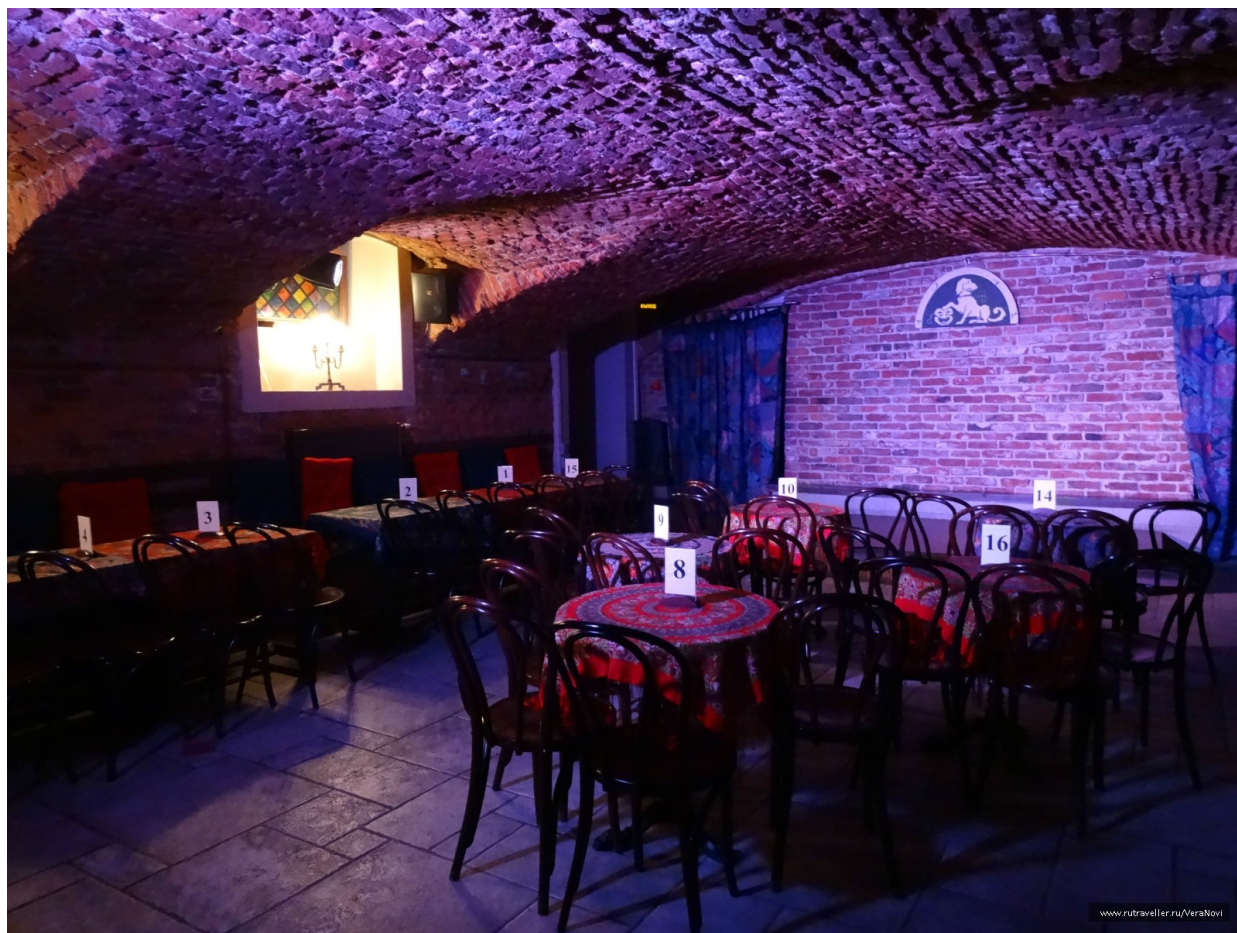
Бродячая Собака. Столики