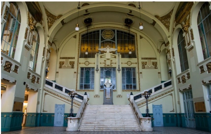
Адмиралтейство в Петрограде. Вход