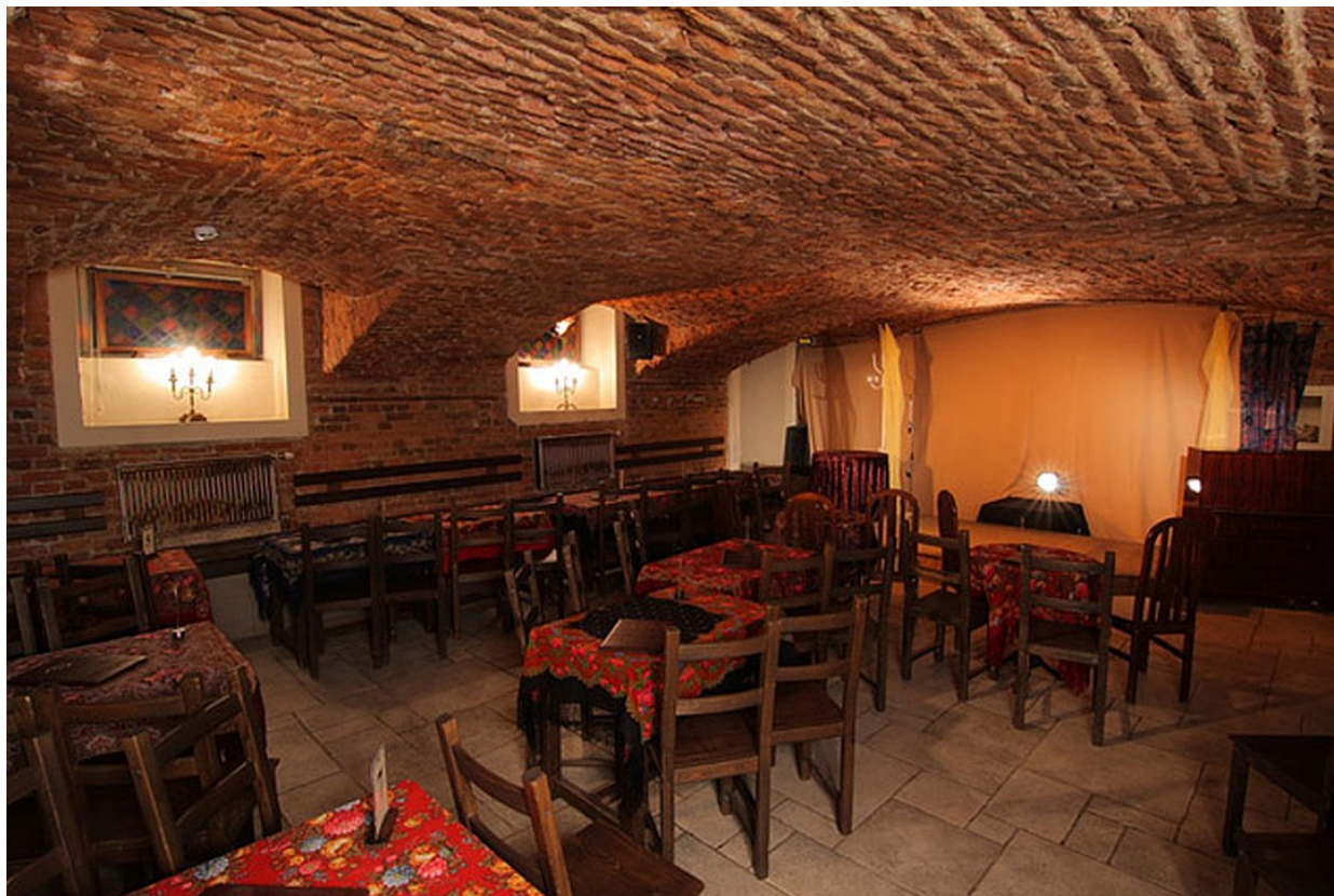
Бродячая Собака. Сцена